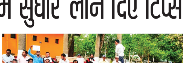
प्रशिक्षण शिविर की मूल बातें

स्थानीय स्तर पर सतत विकास लक्ष्यों के प्रभावी कार्यान्वयन और क्षेत्रीय कौशल विकास को बढ़ावा देने के उद्देश्य से, पंचायती राज मंत्रालय के तत्वावधान में पचमढ़ी में आयोजित तीन दिवसीय प्रशिक्षण शिविर का सफलतापूर्वक समापन हुआ। राष्ट्रीय ग्राम स्वराज अभियान द्वारा प्रायोजित इस कार्यक्रम के अंतर्गत क्षेत्र के पंच ऑफिसरों को विशेष तकनीकी प्रशिक्षण प्रदान किया गया।