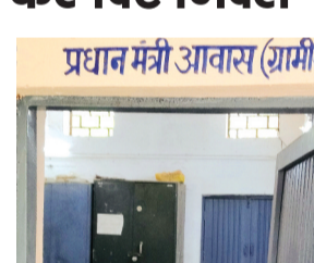
अधिकारी के द्वारा भी समीक्षा की जावेगी।