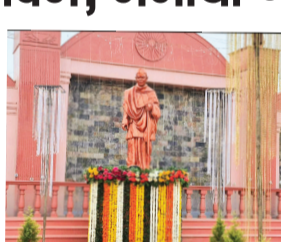
पहुंचकर विधायक एवं अतिथियों ने दादा की प्रतिमा पर माल्यार्पण किया