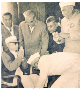
तलाश शुरु हुई थी।

यह चित्र आर्यमें से कई लोगों ने कई बार देखा होगा। मूर्धन्य कवि,साहित्यकार, पत्रकार और संग्राम पं.माखनलाल चतुर्वेदी को सागर विश्वविद्यालय की मानद डी.लिट.उपाधि प्रदान करने के लिए तबके मूर्धन्य शिक्षाविद व राजनेता पं.द्वारकाप्रसाद मिश्र स्वयं माखनलाल जी के घर गये थे।